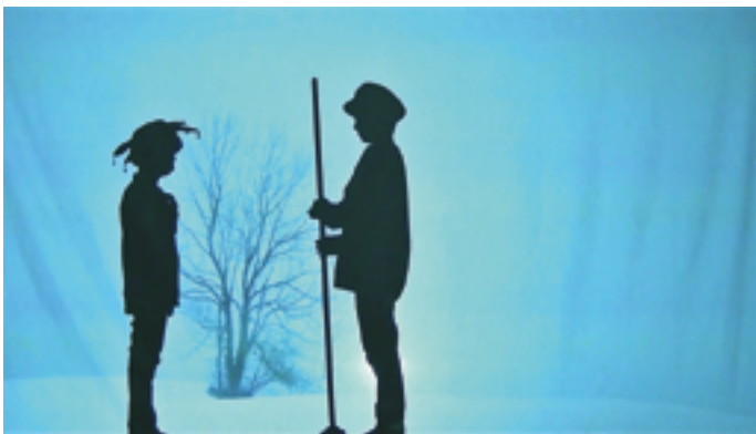
Schattentheater: Die Kinder konnten hinter dem Schattentuch spielen, tanzen, sich entfalten. Wunderbare Bilder entstanden.

Oft sind derartige Entscheidungen durch Internet, Fernsehen und die Werbung beeinflusst. Erkenntnisse hierzu können beitragen, Schülerinnen und Schüler mit speziellen Bedürfnissen bei ihrer Entscheidungsfindung im pädagogischen Alltag besser unterstützen zu können. Die Studie dauert insgesamt 1 Jahr.