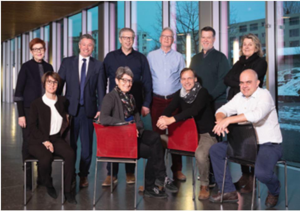
LE CONSEIL DE FONDATION LES BUISSONNETS Janvier 2019

personne de référence et permet de mieux représenter la fondation.