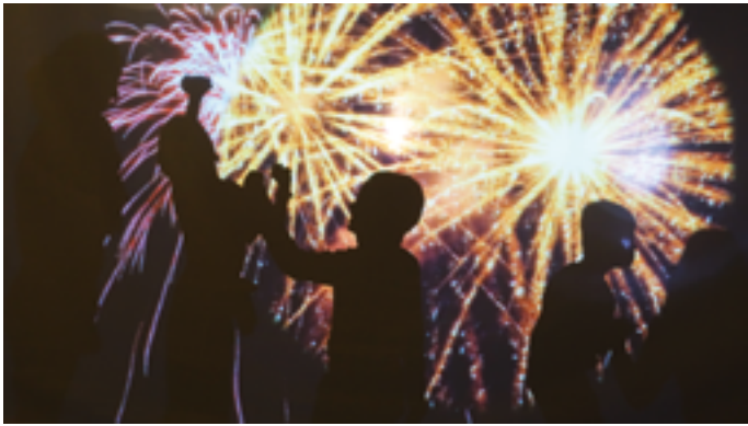
Basales Theater: Es entstand das wunderbare Projekt «Traumzeit».