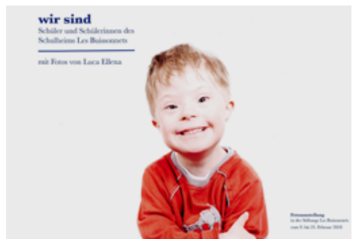
Luca Ellena hat alle Schülerinnen der Tagesschule porträtiert.

tenbilder-Geschichten. Einfache Requisiten wie Luftballons, Seifenblasen, Taschenlampen, Ventilatoren etc. waren zusätzliche Spielelemente. Aus unzähligen Fotos wurde eine Tonbildschau zusammengestellt.